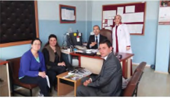
Hasanoğlan Anadolu İmam Hatip Lisesi