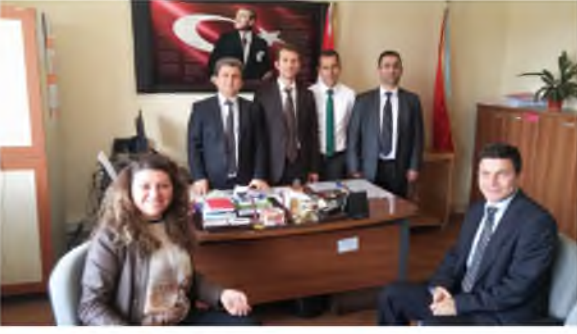
Yaşar Doğu Ortaokulu