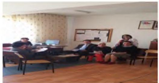
Elmadağ Mesleki ve Teknik Anadolu Lisesi