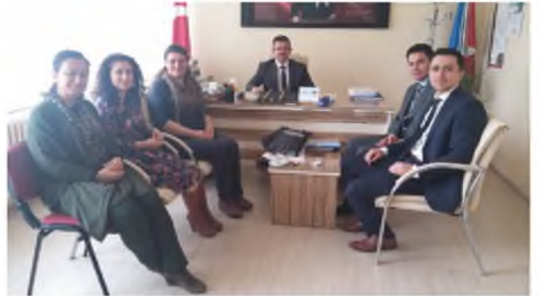
Hasanoğlan Öğretmenler Ortaokulu