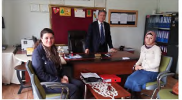
Şehit Şener Gündem Ortaokulu