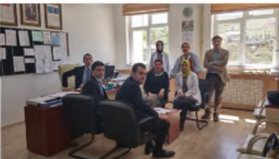
Elmadağ İmam Hatip Ortaokulu