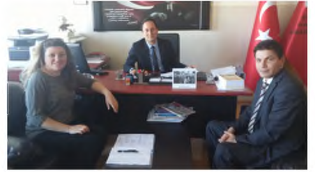
Gazi Şahin Anadolu Lisesi