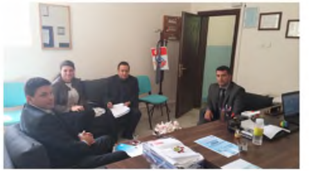
Hasanoğlan Fatih Mesleki ve Teknik Anadolu Lisesi