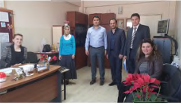
Namık Kemal Ortaokulu