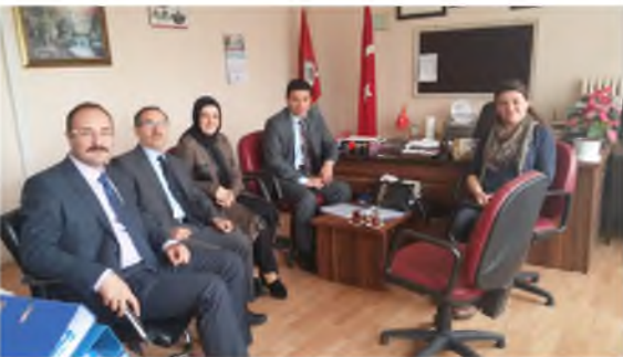
Hasanoğlan Dr. Ahmet K.Mihçioğlu Ortaokulu