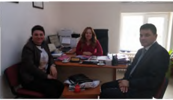
Hasanoğlan Mesleki ve Teknik Anadolu Lisesi