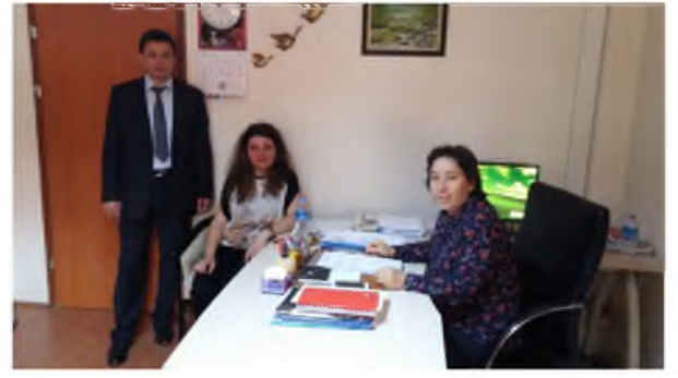
Elmadağ Anadolu Lisesi