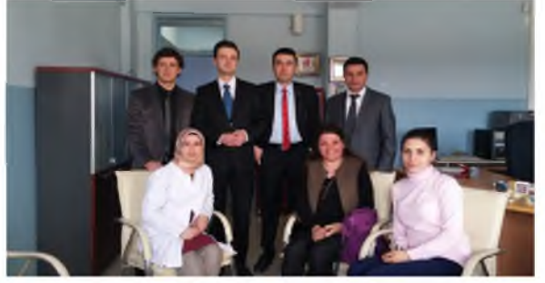
Hasanoğlan İmam Hatip Ortaokulu