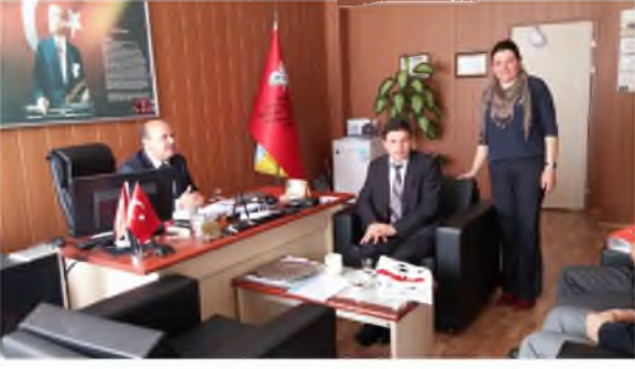
Şehit Sertaç Uzun Mesleki ve Teknik Anadolu Lisesi